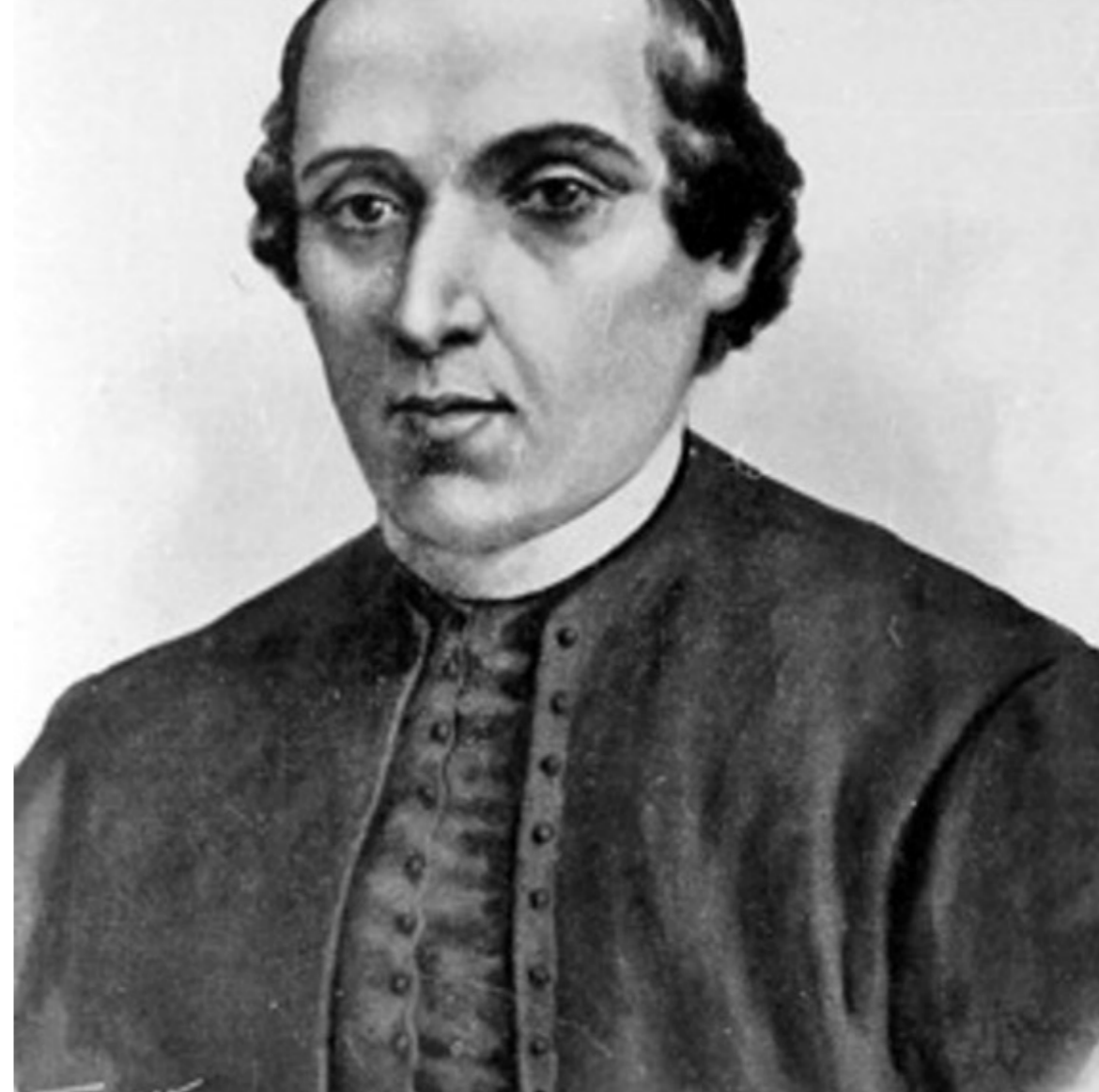
Francisco Javier Clavijero.

De padre peninsular y madre criolla, Francisco Javier Mariano Clavijero y Echegaray vio la luz en el puerto de Veracruz el 9 de septiembre de 1731. Tercero de una familia de once hijos, poco se sabe del resto de sus integrantes,