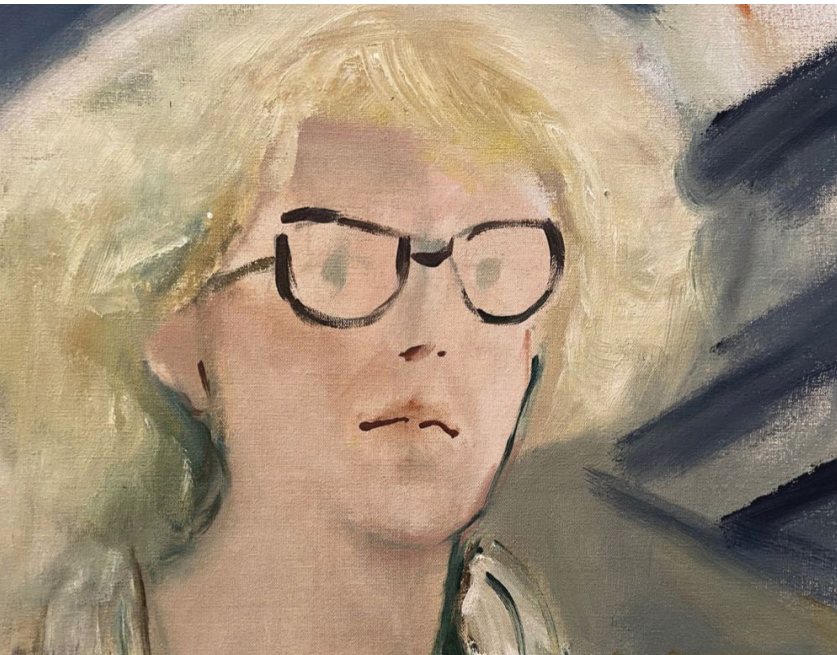
Elvira Gascón, Yo , 1978. Óleo sobre tela, 56x43.3 cm. Colección particular.

El final del comienzo aborda la travesía inicial del exilio y el inicio de una nueva vida en México, marcada por desafíos y renacimiento. Nostalgias se divide en dos secciones: España en el Recuerdo , que evoca las huellas de la patria perdida, y México: Pan, trabajo y hogar , que destaca la adaptación y los lazos formados en el nuevo entorno. ¿Cómo es posible que una mujer se trepe a los andamios? reflexiona sobre la participación clave de las mujeres en el muralismo mexicano, desafiando las barreras de género en un movimiento históricamente dominado por hombres.