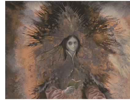
Remedios Varo, Personaje , 1961. Óleo y hoja de plata sobre cartulina. 88x69 cm. Colección particular.

Continuidades, Rupturas y Disidencias explora cómo estas artistas fusionaron vanguardias y tradición mediante propuestas innovadoras que abordan temas como el feminismo y la censura, posicionándose en el panorama artístico. Finalmente, Memorias Colectivas vincula el legado de estas artistas con la memoria del exilio, invitando al público a reflexionar sobre los procesos de migración y la construcción de identidades.